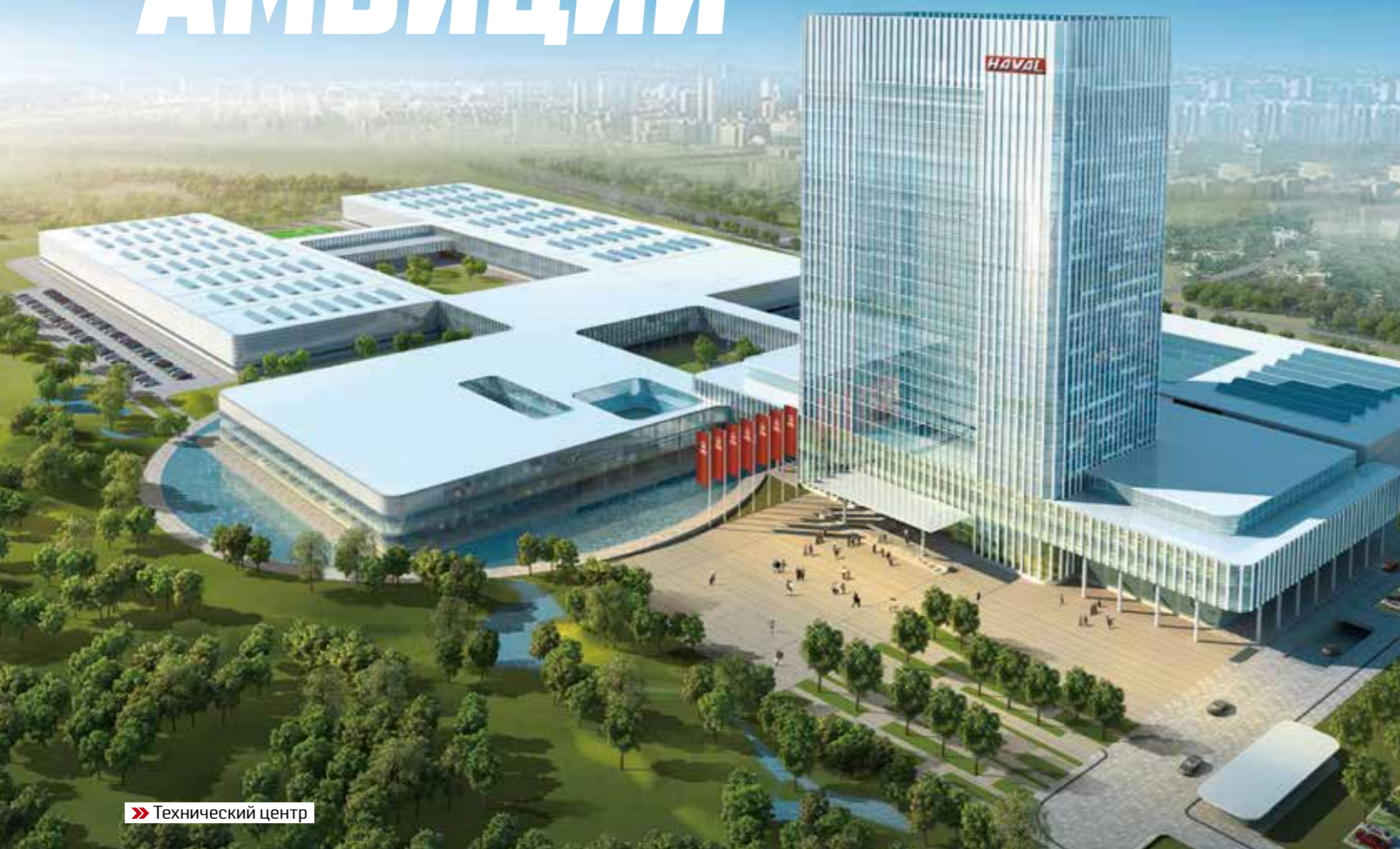
» Технический центр

Динамика развития бренда Haval может служить учебным пособием для многих. Мощная производственная база, серьезные инвестиции в инжиниринг и грамотный маркетинг позволяют занимать лидирующие позиции на родине и осуществлять активную внешнюю экспансию. Первым зарубежным рынком, на который вышел Haval, стала Россия.