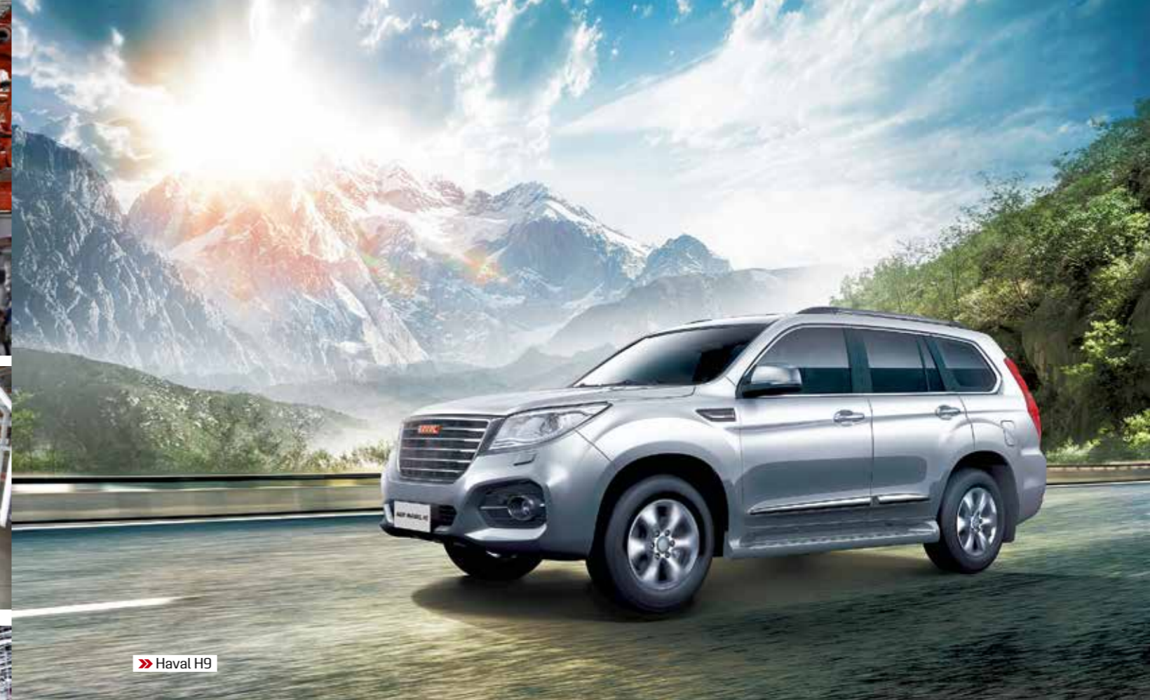
» Haval H9

соответствие всех узлов автомобиля международным стандартам. Совсем недавно, 28 марта 2018 года, состоялась торжественная церемония закладки первого камня в фундамент нового завода в Чунцине. Согласно графику его строительство продлится 18 месяцев, а старт производства запланирован на конец 2019 года. Мощность предприятия оценивается в 160 тыс. машин ежегодно, и, помимо кроссоверов и внедорожников Haval, здесь будут выпускаться пикапы под маркой Great Wall.