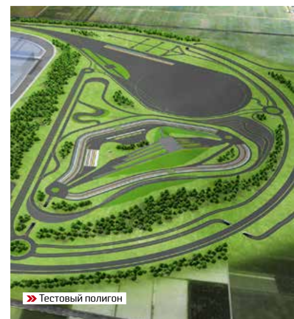
» Тестовый полигон

класса SUV. Модель Haval H6 стала не только первой по востребованности в сегменте SUV, но и второй — в общем сегменте легковых машин огромного китайского рынка, а также заняла пятую строку глобального рейтинга кроссоверов, по версии агентства focus2move. Сам бренд Haval попал в список самых дорогих товарных марок Global 500, подготовленный консалтинговым агентством Brand Finance. За год стоимость бренда возросла на 127% и достигла $6,8 млрд, что поставило Haval выше всех других автомобильных брендов Китая.