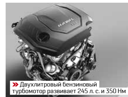
» Двухлитровый бензиновый турбомотор развивает 245 л. с. и 350 Нм