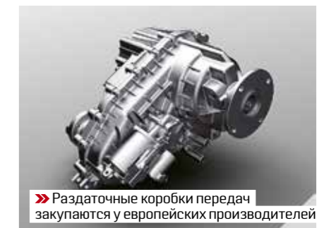
» Раздаточные коробки передач закупаются у европейских производителей