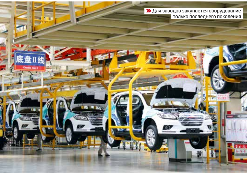
» Для заводов закупается оборудование только последнего поколения