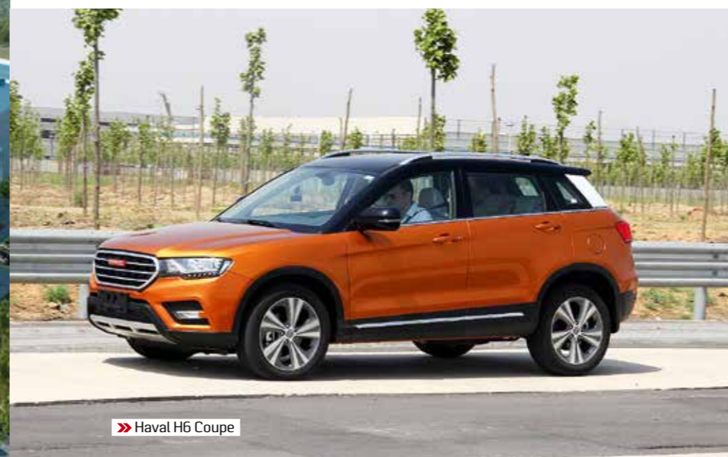
» Haval H6 Coupe