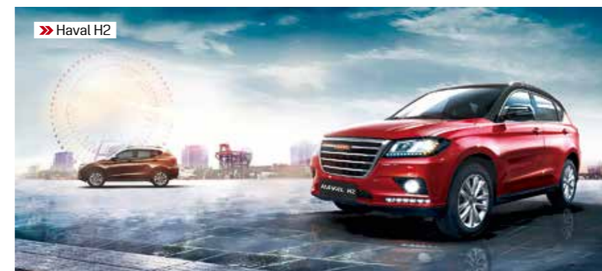
» Haval H2