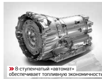
» 8-ступенчатый «автомат» обеспечивает топливную экономичность