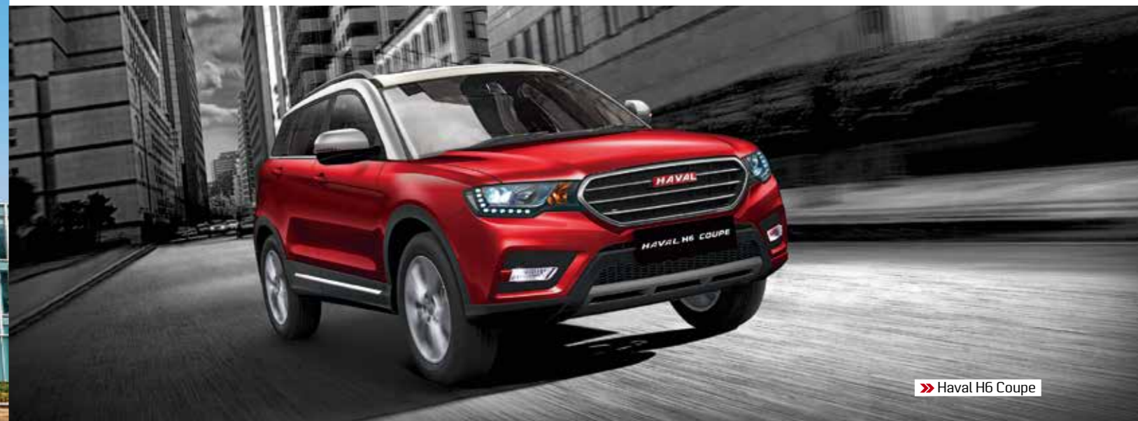
» Haval H6 Coupe

завода Haval. Здесь создается производство полного цикла мощностью 150 тыс. машин, рассчитанное на 2500 рабочих мест. Объем инвестиций в предприятие составит около 18 млрд руб. Серийное производство начнется в 2019 году, а степень локализации будет последовательно возрастать с 30 до 60%. Выпускаемые автомобили